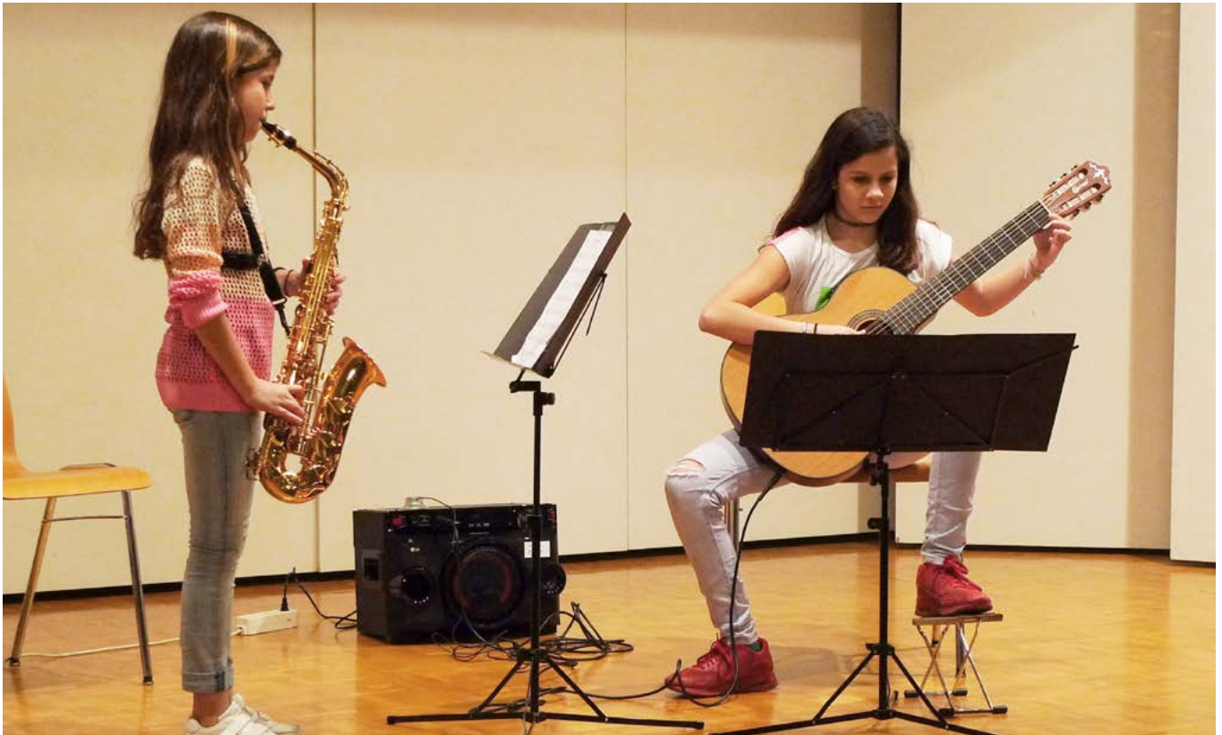
Bietet immer wieder aussergewöhnliche Kombinationen: Das Geschwisterkonzert am 20.03.2018