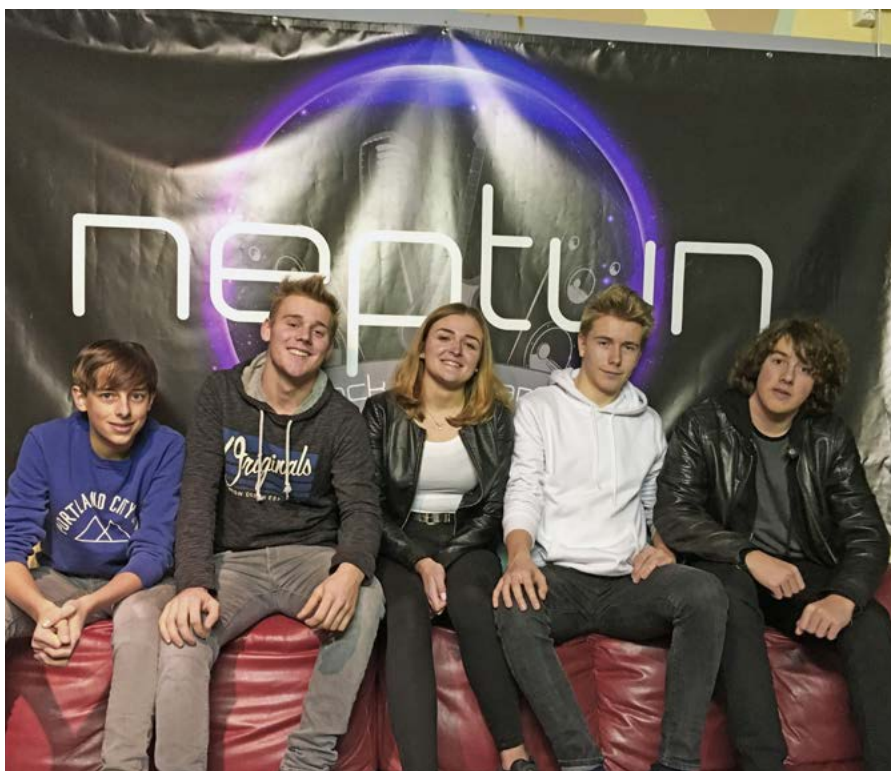
Die Band „Neptun“ bedankt sich bei ihrem anonymen Spender

Neptun dankt an dieser Stelle dem anonymen Spender von Herzen und hofft, dass die Nachricht die entsprechende Person auf diesem Weg erreicht.