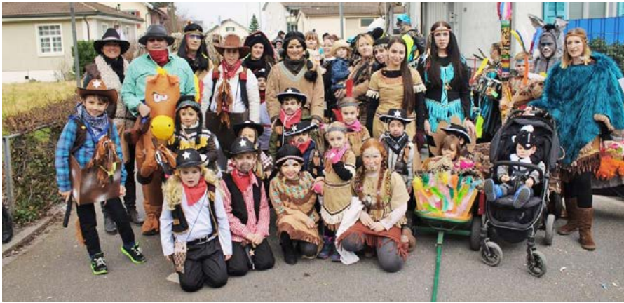
Das Familienforum Rhynegg am diesjährigen Fasnachtsumzug in Rheineck