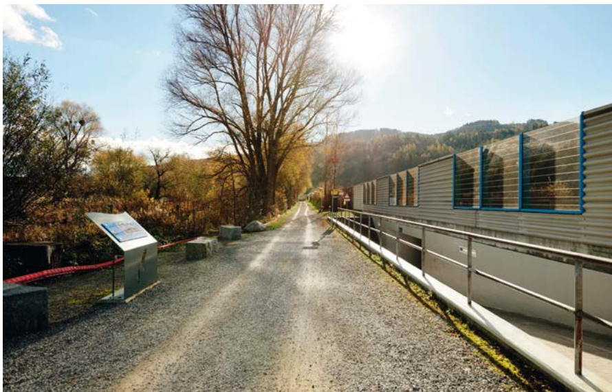
Der Radweg soll aufgewertet werden