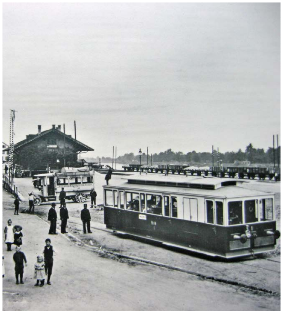
Eines der Bilder der Ausstellung „Alt-Rheineck“ im „Hecht“ zeigt das Rheinecker Tram