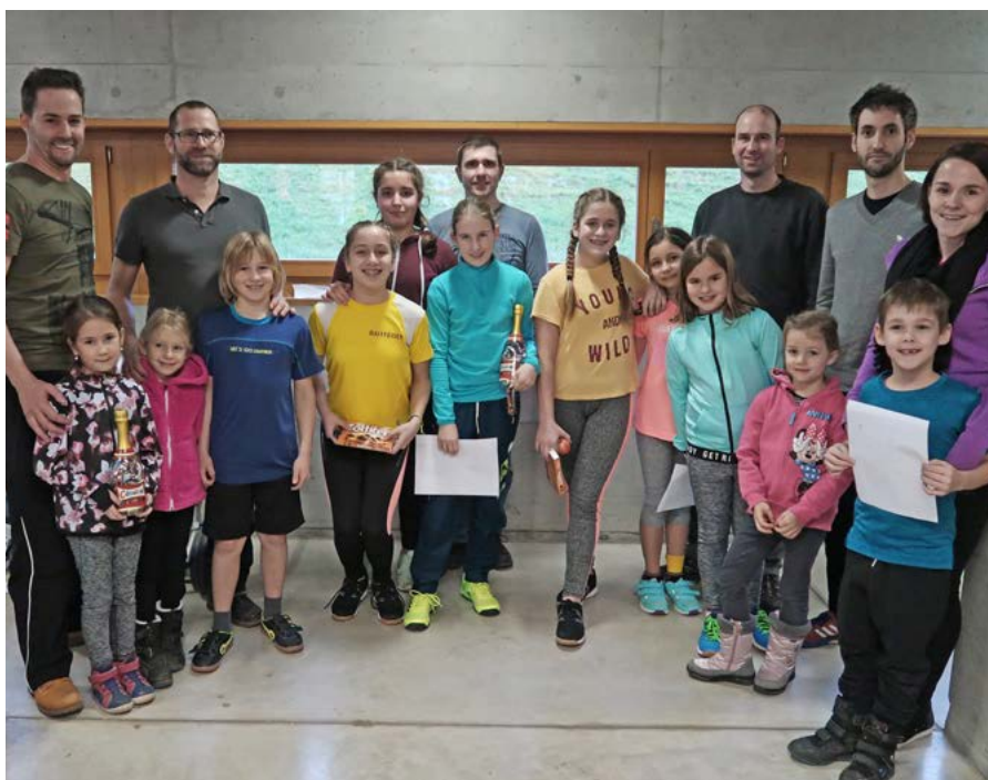
Mit 72 Teilnehmern konnte das MUVAKI-Turnier einen neuen Teilnehmer-Rekord verbuchen

Weitere Informationen zur Ortspartei und den Anlässen finden Sie unter www.fdp-rheineck.ch .