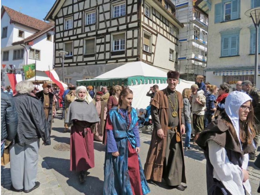
Der nächste Mittelaltermarkt findet am 11. und 12. Mai 2019 statt