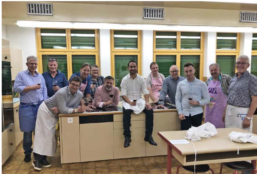
Die FDP-Männer hatten sichtlich Spass am Herd