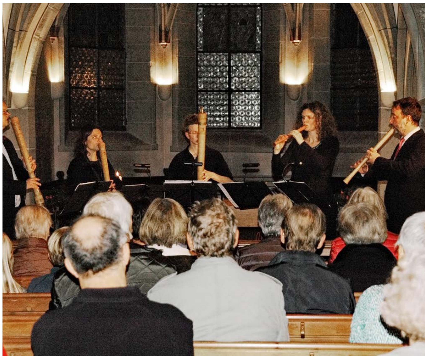
Das international renommierte Blockflötenensemble B-Five begeisterte das Publikum

Mit einem grossen Applaus bedankte sich das Publikum beim Consort für die herausragende Darbietung.