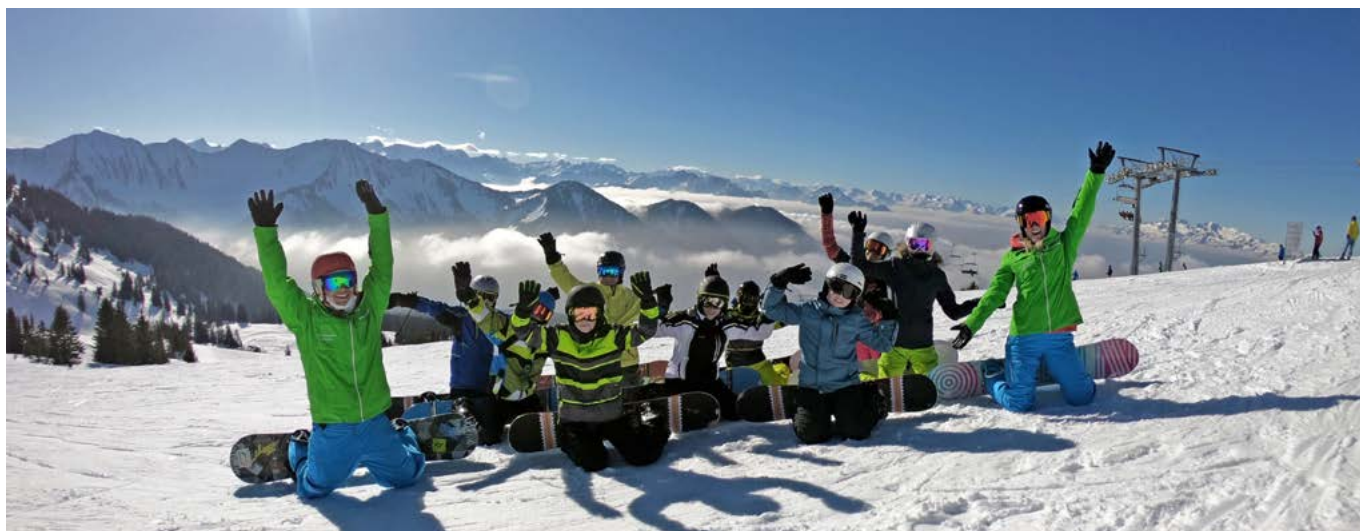
Am 5. Januar 2019 starten die Jugendski- und Snowboardkurse

Carfahrt / ½ Tageskarte / Ski- Snowboardkurs mit Leiterbetreuung. Die Karte ist übertragbar, ohne Geldrückgabe.