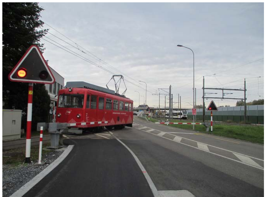
Seit genau 60 Jahren verbindet der rote Zahnrad-Triebwagen Rheineck mit Walzenhausen.

Seit Dezember 1958 und damit seit 60 Jahren verkehrt zwischen Rheineck und Walzenhausen ein roter Triebwagen. Die Rheineck-Walzenhausen-Bahn (RhW) ist mit einer Länge von nicht ganz zwei Kilometern die kürzeste Bahn des öffentlichen Verkehrs in der Ostschweiz.