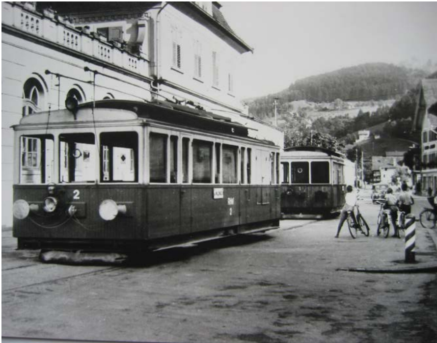
Die Tramwagen warten vor dem Rheinecker Bahnhofgebäude auf Passagiere