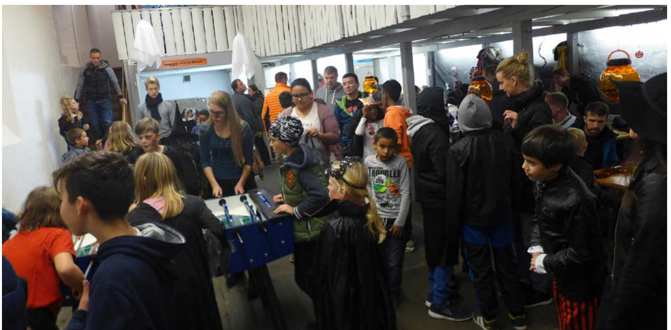
An den 2. Hallo win Games im «Alten Feuerwehrdepot» herrschte eine tolle Stimmung

Um 18 Uhr wird ein stimmungsvoller Lichtgottesdienst gefeiert, der