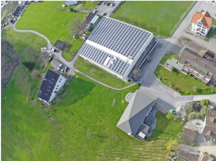
Die Bedingungen für die Rücklieferung von Energie für das Jahr 2019 wurden festgelegt

sollen ausgelagert bzw. ihr zur Ausführung übertragen werden. Die Energieverrechnung, Kundenbetreuung sowie Finanzbuchhaltung sollen jedoch weiterhin bei der Stadt Rheineck verbleiben. Auch das Netz soll im eigenen Eigentum verbleiben.