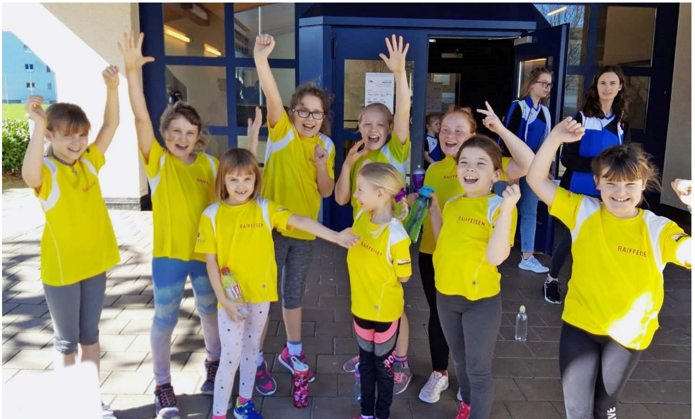
Die Jugimädchen belegten beim diesjährigen KIFULA den 5. Rang