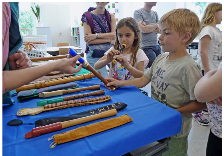
Alle Instrumente können beim Infoabend ausprobiert werden

Im Anschluss an den Infotag bietet die Woche des Offenen Unterrichts eine weitere Möglichkeit den Unterricht im gewünschten Fach kennenzulernen. Alle interessierten Eltern und Schüler können vom 06. bis 10. Mai den Unterricht im gesamten Musikschulgebiet besuchen. Anmeldungen werden erbeten über das Sekretariat der Musikschule unter 071 888 52 66 oder per Mail an info@msaar.ch .