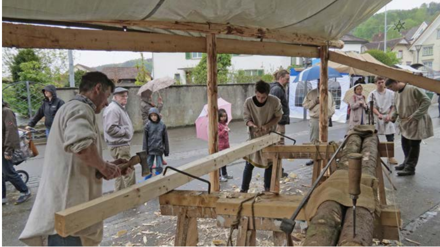
Auch heute noch fliegen die Späne: Mit Beil und Breitaxt bearbeiten die jungen Zimmerleute die Balken