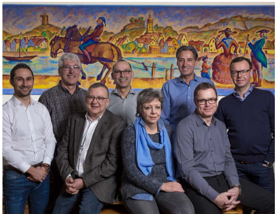
Wer soll dem Stadtrat ab 1. November 2019 vorstehen?

Idealerweise bringt ein/e Stadtpräsident/in eine gute Allgemeinbildung, solide Rechts- und Finanzkenntnisse, Verwaltungspraxis oder Kurse für Verwaltungstätigkeit, Verhandlungsgeschick sowie gute Kommunikationsfähigkeiten, Führungserfahrung und ein Flair für Organisationsaufgaben mit.