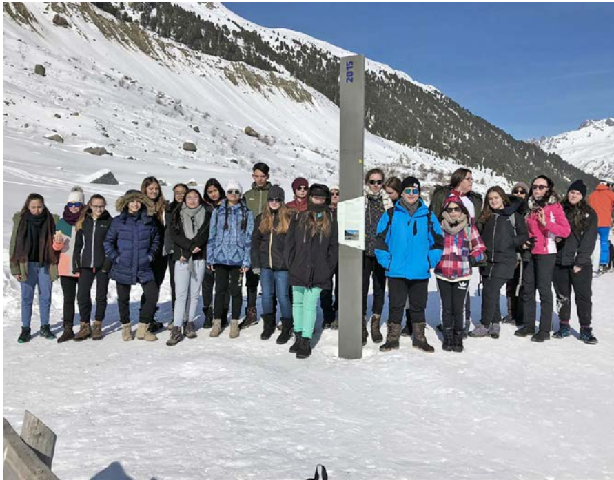
Das diesjährige Winterlager fand wiederum in Celerina statt

mensein am Abend. Nach dem feinen Nachtessen ein erster Höhepunkt: Die Jugendlichen bekommen ihr Handy für eine Dreiviertelstunde. Um acht Uhr startet das Abendprogramm mit Fackellauf, Spieleabend, Karaoke und Champions League. Natürlich darf auch ein bunter Abend mit Disco nicht fehlen. Nach so viel Aktivität werden auch die härtesten Jungs und Mädchen vom Schlaf überwältigt. Dieser ist nötig, um auch den nächsten Tag im wunderschönen Engadin geniessen zu können.