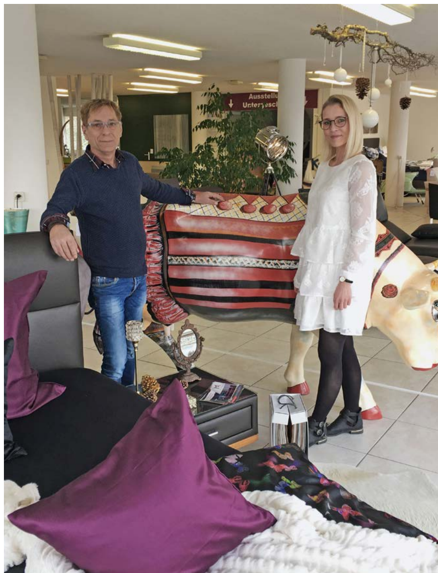
Der KMU Apéro des Unternehmerforums fand dieses Jahr bei Monti's Möbelhaus statt