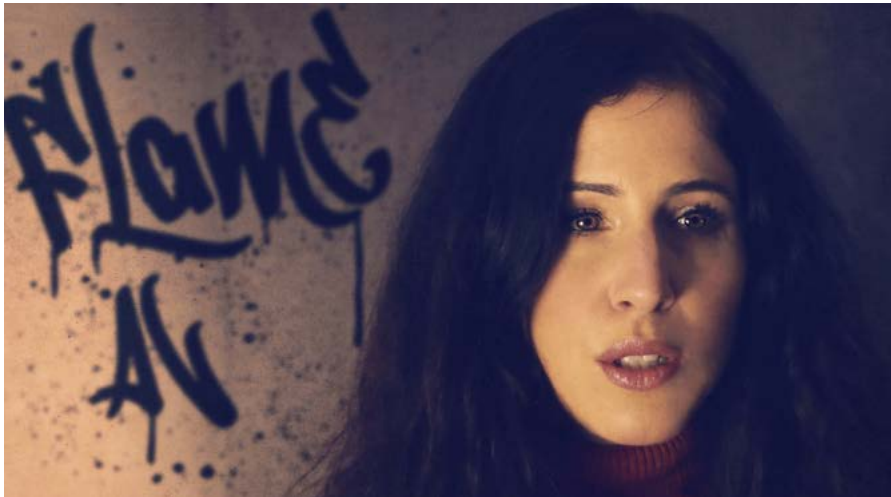
Ausnahmesängerin Ann Vriend kommt nach Rheineck