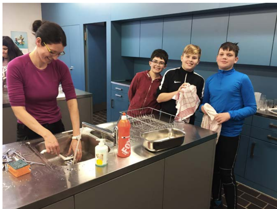
Auch beim Abwasch und der Mithilfe in der Küche hatte man Spass

Da der Wetterbericht von Anfangs Woche dann doch nicht ganz wahr wurde und sich am Freitag eine Regenwolke ausgiebig über Laterns niederliess, kehrten wir ein bisschen enttäuscht sogleich wieder nach Rheineck zurück und verbrachten den Tag spielend und sportlich im Neumüli-Schulhaus. Es dauerte zwar eine Weile, bis alle Eltern über die aktuelle Situation informiert waren, aber schliesslich fanden wir für alle Kinder eine Lösung. Eine kleine