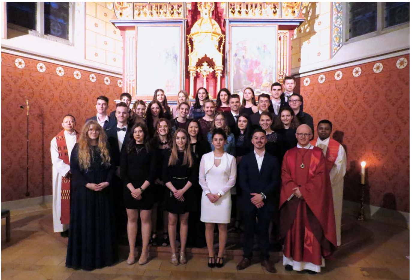
Firmung in der Katholischen Kirche Rheineck

Der Firmspender gab den Jugendlichen zu bedenken, wer sie in den Augen der anderen und in den Augen Gottes sind. Dies hat Konsequenzen für unsere Orientierung. „Jesus selbst hat eine Spur gelegt“, so der Generalvikar weiter, „wie Leben gelingen kann. Der Heilige