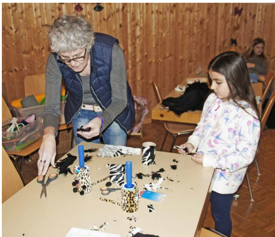
Es wurden kreative Ostergeschenke gebastelt

Vom 15. - 18. April, jeweils 14.00 - 17.00 Uhr, findet die KIWO 2019 statt. Das diesjährige Thema lautet «Mir mached e Party!». Während der Kinderwoche bereiten wir gemeinsam ein riesiges Fest vor. Es wartet eine Woche voller Spass, Kreativität und Überraschungen. Natürlich gehören auch Geschichten, coole Songs und leckere z'Vieris dazu – bisch au debii? Die Kinderwoche ist für Kinder vom Kindergarten bis zur 6.Klasse, die Kosten betragen Fr. 5.- pro Nachmittag, Bei Interesse oder Fragen melden Sie sich bei am besten bei Angela Indermaur (071 888 69 82, 079 278 62 73).