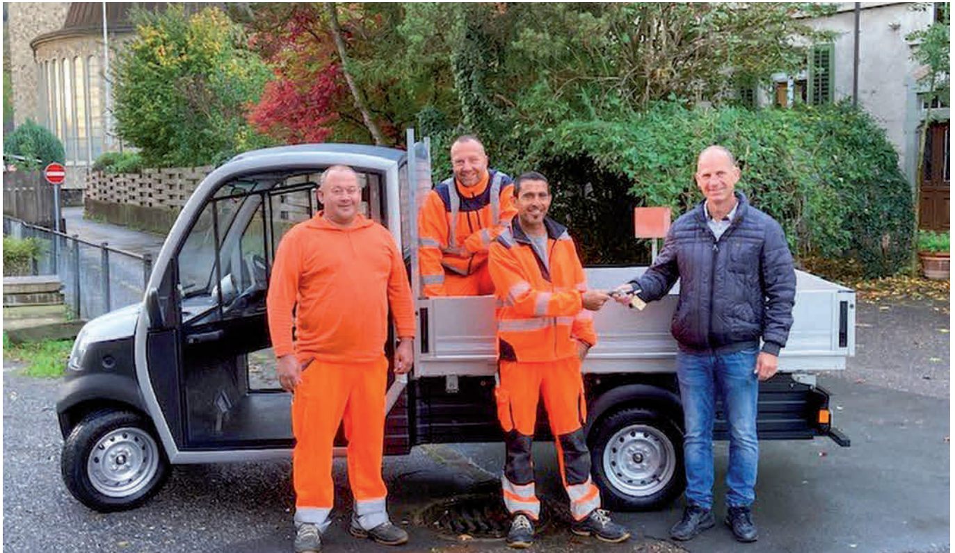
Das neue Bauamtsfahrzeug ist mit Strom betrieben und seit kurzem im Einsatz.