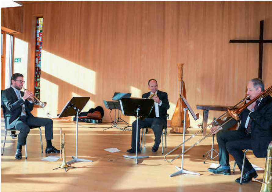
Die Blechbläser werden wieder beim Neujahrskonzert der Lehrpersonen auftreten.

anlass geboten, der den Jugendlichen bestimmt noch lange Zeit in Erinnerung bleiben wird.