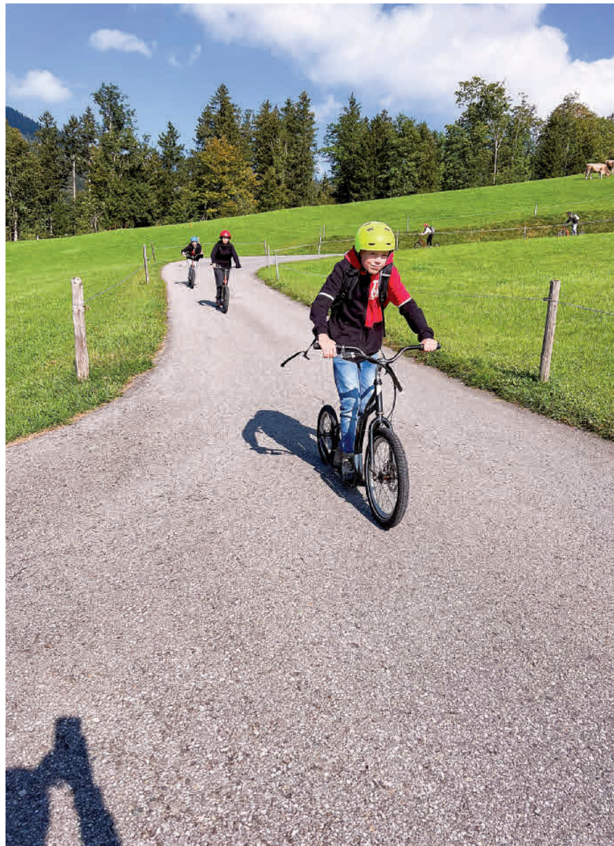
Vom Ruhesitz bis nach Brülisau in vollem Tempo.

Mit Bahn und Bus ging es zum Kobelwald. Die Wanderung führte via Kristallhöhle und Strüsler auf den Montlinger Schwamm. Die anfangs ausgelassene Stimmung drohte beim Aufstieg beinahe zu kippen und manch eine Schülerin fragte sich, wer denn diese Wanderroute ausgesucht hatte. Die Jugendlichen kamen mächtig ins Schwitzen.