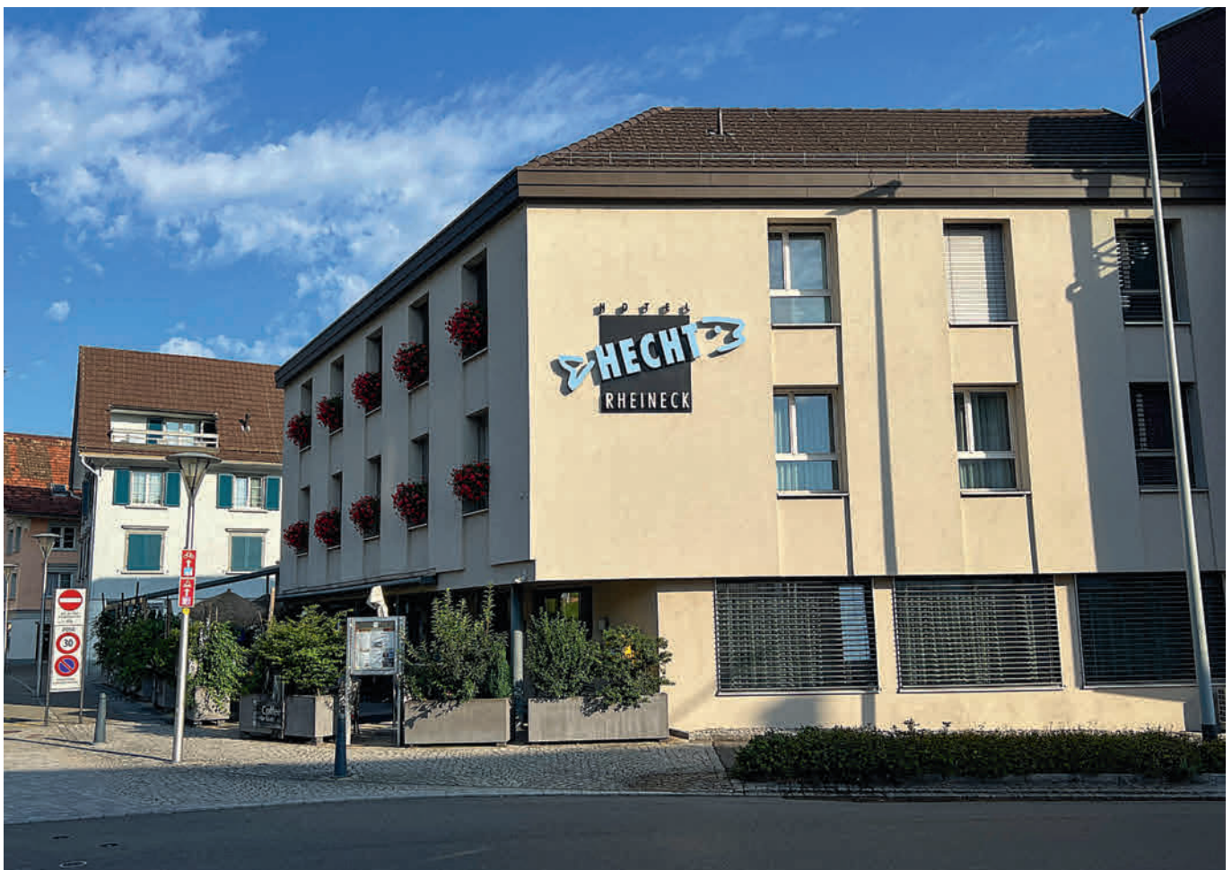
Das Pächter-Ehepaar Majer verlässt den Hecht im 2024. Das Hotel befindet sich im Eigentum der Stadt Rheineck.