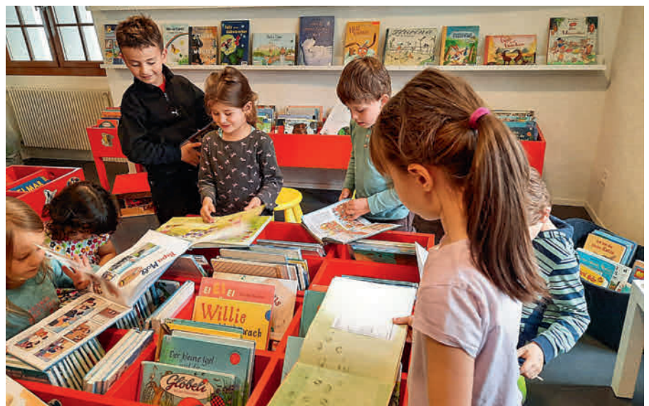
Es ist jedes Mal eine schönes Gefühl, den Kindern in der Bibliothek eine Freude zu bereiten.

www.biblio-rheineck.ch Facebook: Bibliothek Rheineck Instagram: bibliothekrheineck