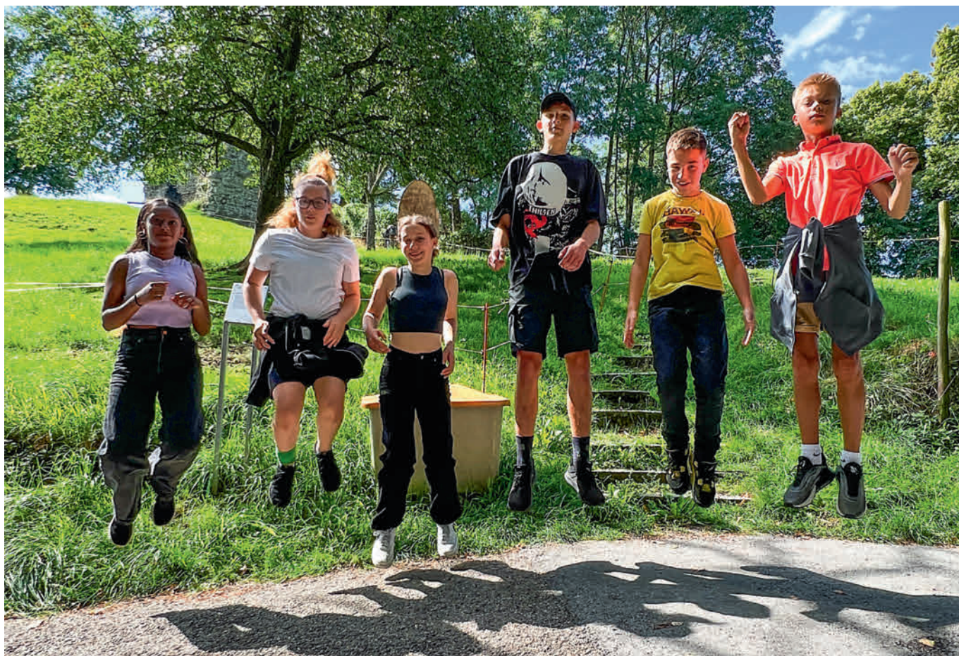
An jedem Posten der Schnitzeljagd mussten Aufgaben gelöst und ein Foto geschossen werden.

versammelten sich alle Klassen und Lehrpersonen wieder in der Aula, um den Tag Revue passieren zu lassen und den Tagessieger der Schnitzeljagd zu küren.