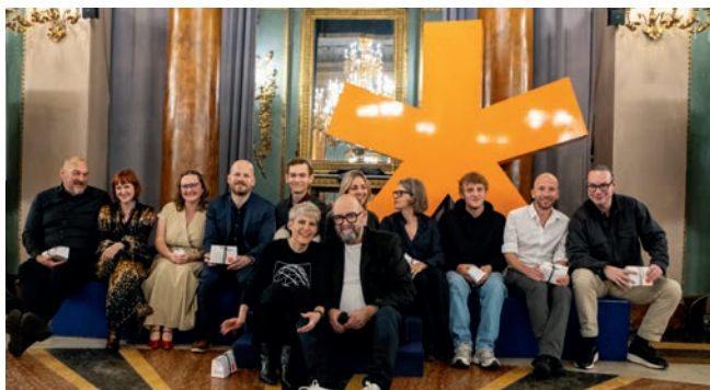
In Florenz feierte DACHCOM das 40-jährige Bestehen. Auf dem Bild zu sehen sind die bei der Organisation des Jubiläums beteiligten Mitarbeitenden.