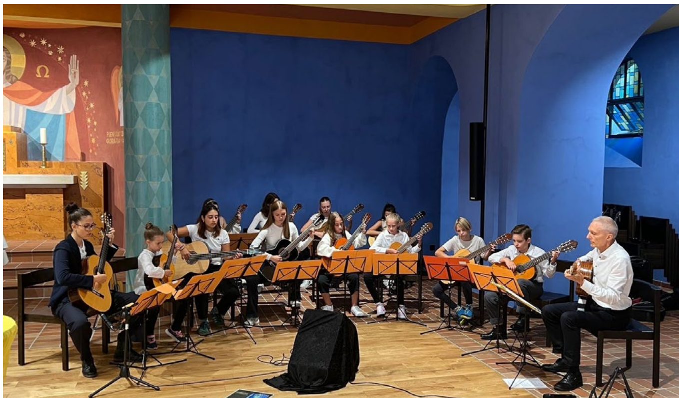
Das Ensemble Flying Notes wird auch in diesem Jahr wieder am RhyContest teilnehmen.

ble Flying Notes (beide Klasse Rainer Thiede) werden sich in Rheineck einer dreiköpfigen Fachjury stellen. Amanda Ahmeti und Lia Reifler aus der Klasse Peter Giger werden in Heerbrugg in der Wertung Jazz-Rock-Pop-Gesang auftreten.