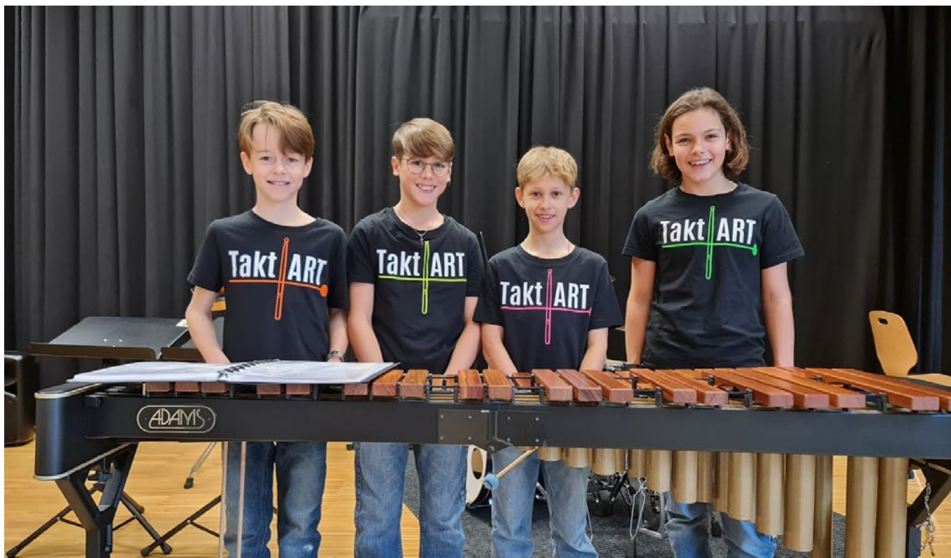
Das Ensemble TaktArt tritt am Podium der Jugend auf.

und entschied sich dafür, während ihre Zwillingsschwester beim Klavier blieb. Beide spielen heute im Duo und nahmen 2018 ihre erste CD auf.