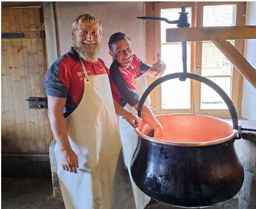
Beim Ausflug der Männerriege Rheineck wurde ein «Männerriege-Alpkäse produziert.