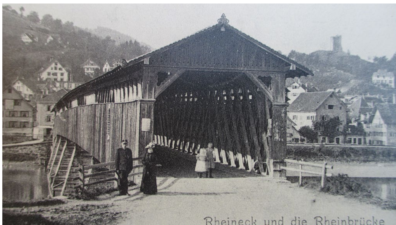
Rheineck Maler Herzig / Rheineck-Gaissau-Brücke.

Im Zuge des Autobahnbaus durch das Rheintal Anfang der 1960er Jahre hatte die Betonbrücke einem neuen Übergang zu weichen, der am 07. Juli 1962 dem Verkehr übergeben werden konnte. Ebenfalls Opfer des Autobahnbaus wurde das 1910 erstellte Rheinecker Zollhaus. Die heutige Brücke zwischen Gaissau und Rheineck entstand 1996.