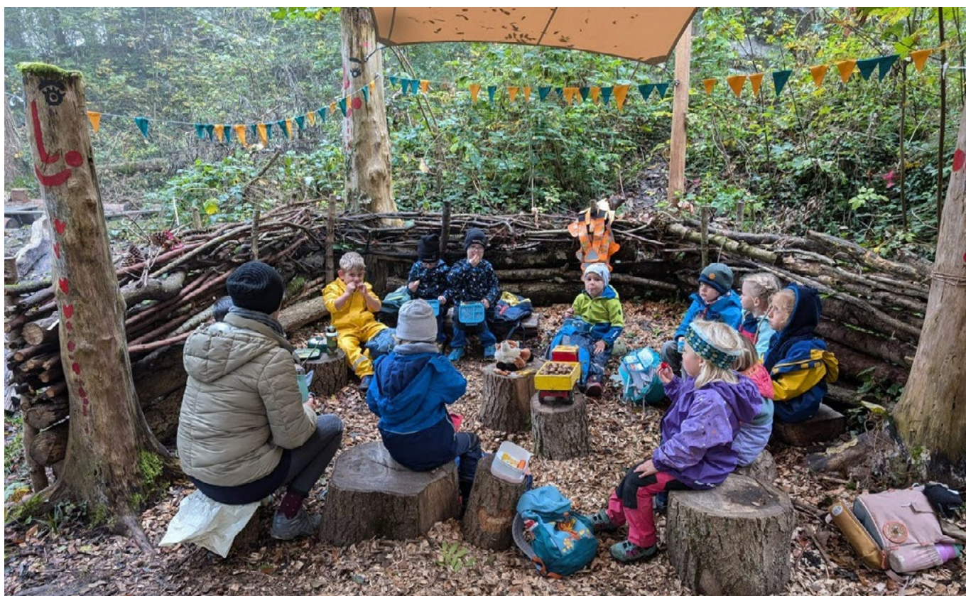
Die «Waldfüchse» geniessen ihren Znüni im «Waldstübli».

Die Anmeldefrist für den Instrumental- und Gesangsunterricht an der Musikschule Am Alten Rhein läuft bis zum 30. November. Die Schule bietet ein