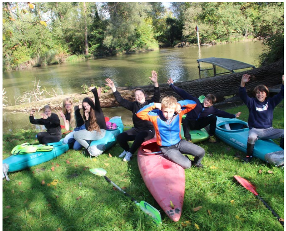
Der Ferienpass Am Alten Rhein ermöglichte vielen Kindern eine kunterbunte Ferienwoche.

Einige Schnappschüsse zum Ferienpass 2024 finden Sie auf unserer Homepage www.fpaar.ch