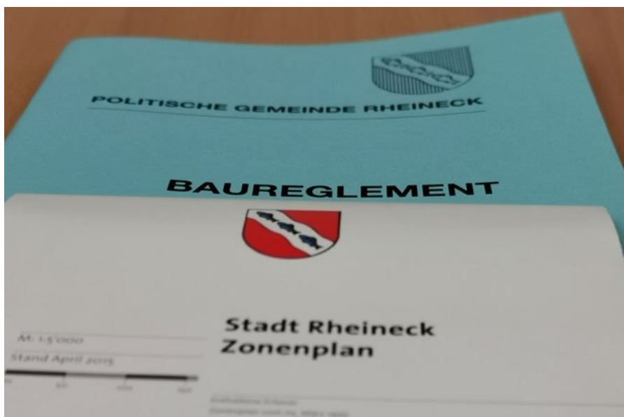
Baureglement und Zonenplan sollen revidiert werden.

erscheinen neu grundsätzlich als Landwirtschaftszone, da deren Vorschriften bereits heute zur Anwendung gelangen.