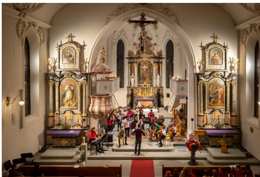
Die Kirche Thal bietet einen würdigen Rahmen für das Weihnachtskonzert.

den 04. Dezember um 17.00 Uhr statt. Geplant sind festliche Beiträge der Blockflöten-, Streicher- und Gitarrenensembles. Aber auch Chor und solistisch auftretende Schüler*innen werden zur vorweihnachtlichen Stimmung beitragen. Es ergeht eine herzliche Einladung an die gesamte Bevölkerung.