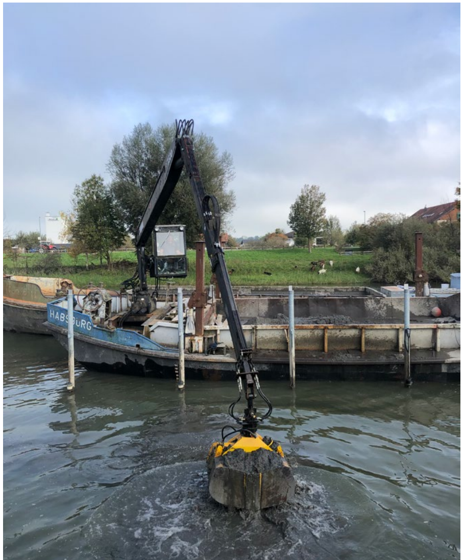
Der Start der Ausbaggerung erfolgte am 14. Oktober bei idealen Wetterbedingungen.

Nach dem Einreichen diverser Bodenproben (Sedimentproben) erhielt die Stadt Rheineck Ende 2023 vom Amt für Wasser und Energie die Bewilligung.