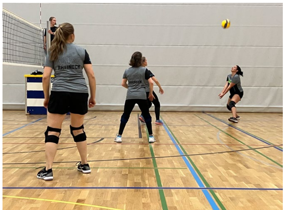
Volley Rheineck - neue Spielerinnen sind jederzeit willkommen.

Die Mitglieder des Volley Rheineck treffen sich jeweils Ende August für einen Velo-Ausflug. Dieses Jahr hat uns die Tour zur Habsburg in Widnau