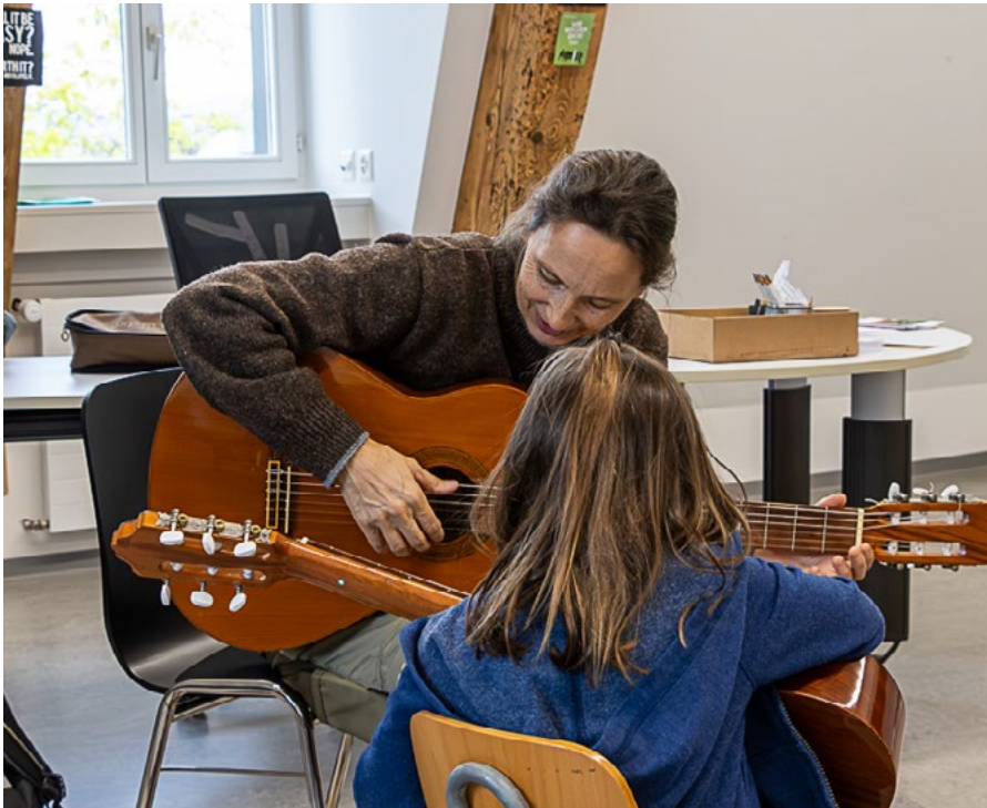
Die Musikschule Am Alten Rhein bietet verschiedene Infoveranstaltungen an.

breites Spektrum an gängigen Musikinstrumenten sowie Chöre, Ensembles und Kurse für Erwachsene an den Standorten Thal-Buechen-Staad-Altenrhein, Rheineck und St. Margrethen an. Zudem können auch weniger verbreitete Instrumente wie Hackbrett, Çifteli, Ukulele oder Schwyzerörgeli erlernt werden. Bei Fragen hilft Ihnen das Sekretariat unter 071 888 52 66 oder info@msaar.ch weiter. Ab- und Ummeldungen sind ebenfalls bis Ende November möglich. Mehr Infos auf www.msaar.ch .