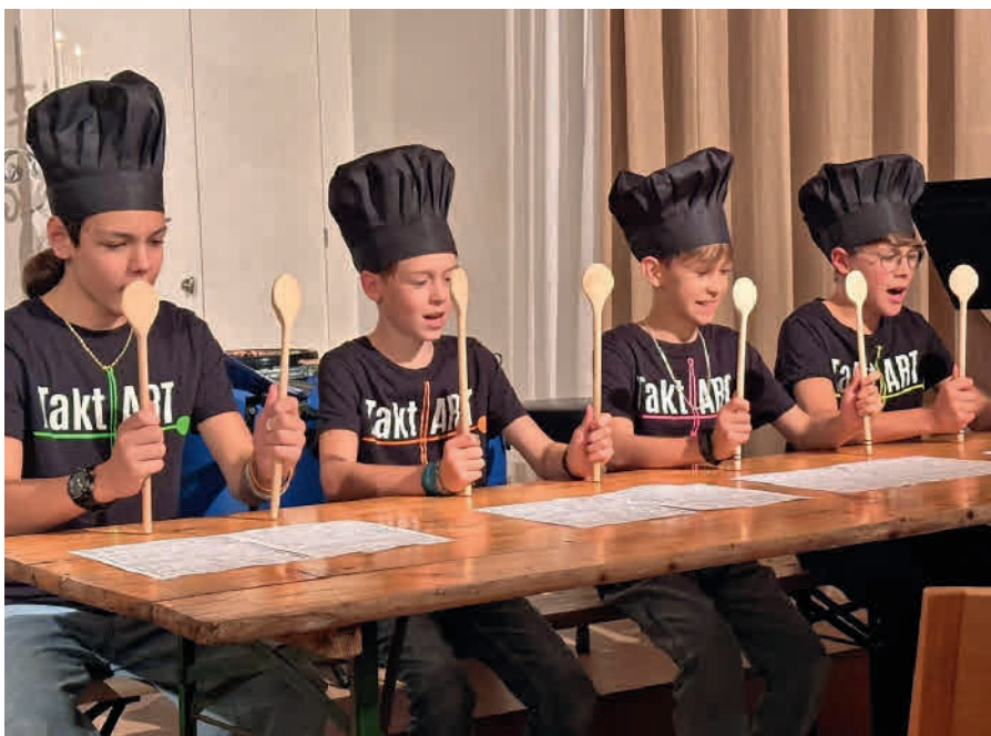
Das Ensemble TaktArt erhielt beim RhyContest einen ersten Preis und volle Punktzahl.