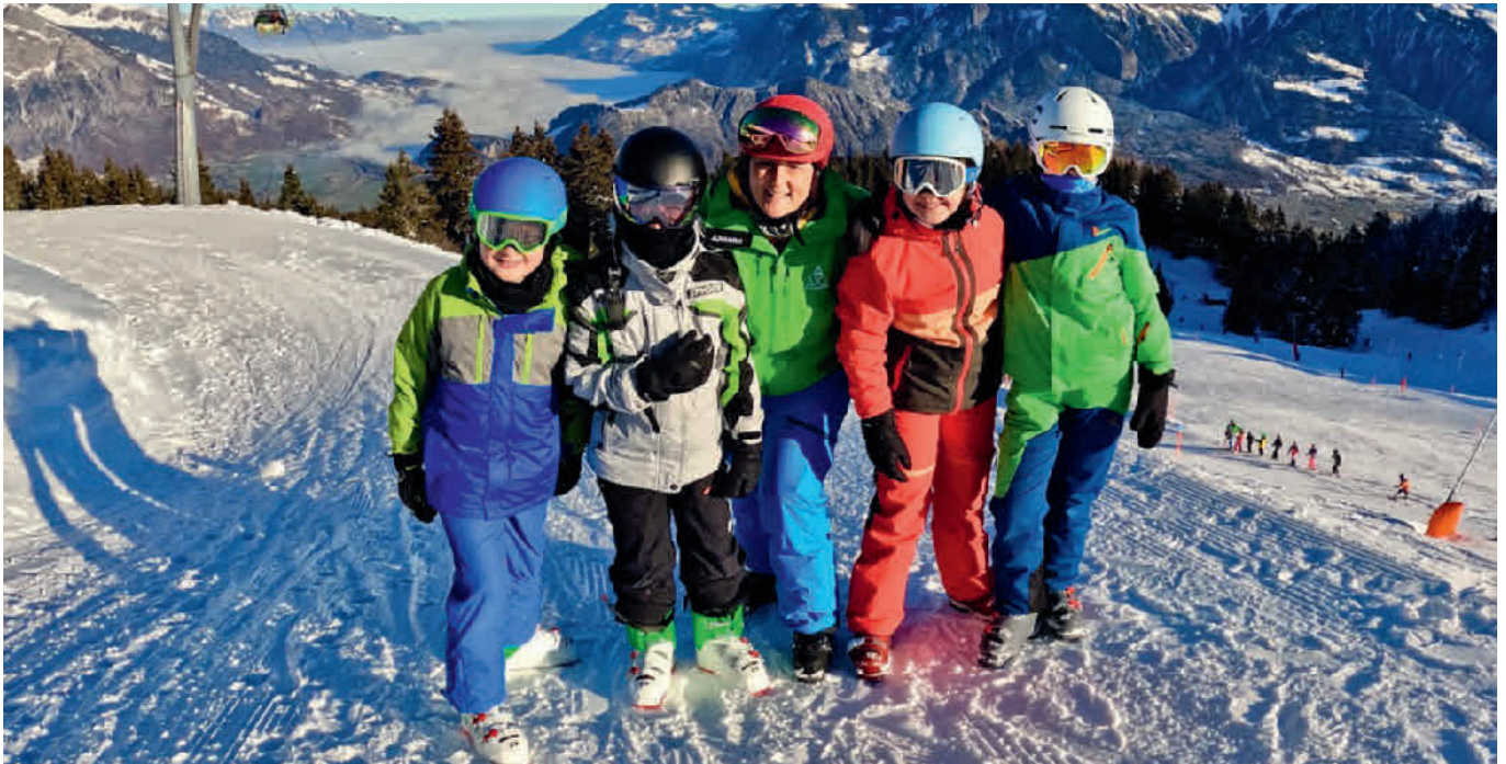
Der Ski- und Snowboardclub bietet einen Jugendski- und Snowboardkurs an.