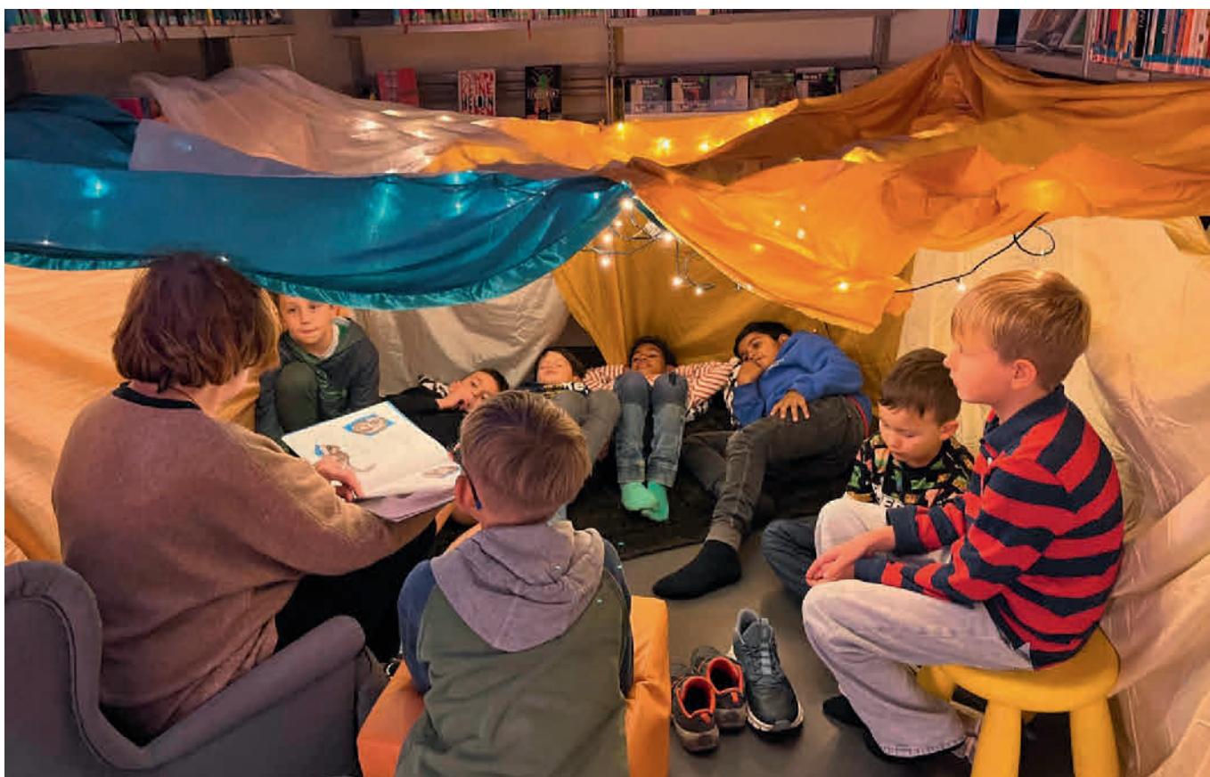
In der Lesehöhle lauschten die Kinder gespannt den Geschichten.

Die Bibliothek bleibt über die Festtage analog den Schulferien vom 22. Dezember 2024 bis 6. Januar 2025 geschlossen. Wir wünschen eine schöne Advents- & Weihnachtszeit mit Kerzenglanz und Lesezeit.